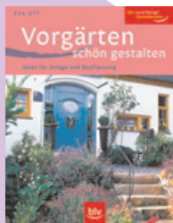
Ratgeber für die Gestaltung des Vorgartens, 10,95 Euro, BLV Verlag

Schluss mit dem lieblosen Rabatten-Einerlei. Das Buch „Vorgärten schön gestalten“ von Eva Ott macht Lust, neue Gestaltungsmöglichkeiten auszurobieren, Ideen für Anlage und Bepflanzung zu verwirklichen. Die Gartenbau-Ingenieurin zeigt anhand verschiedener Gestaltungsbeispiele, wie man das „Tor zum Haus“ gekonnt in Szene setzt. Ihre Vorschläge inspirieren, regen Fantasie wie Kreativität an. Mit 105 Farbfotos und 37 farbigen Illustrationen, 95 Seiten.