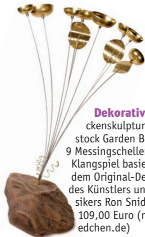
Dekorativ: Glockenskulptur „Woodstock Garden Bell“ mit 9 Messingschellen. Das Klangspiel basiert auf dem Original-Design des Künstlers und Musikers Ron Snider, ca. 109,00 Euro ( nordladedchen.de )

Faszinierend: Wasser und Naturstein – ein Zusammenspiel von Weich und Hart, das vor die Haustür passt. Gestalten Sie Ihr eigenes Wasserspiel und lassen Sie sich beraten z. B. von den Fachleuten vom Natursteinwerk Rechtglaub-Wolf.