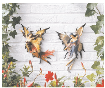
Zauberhafte Wesen: Die Elfen Rexana und Raquel verbreiten eine märchenhafte Atmosphäre. Handbemalt, aus Polyresin, 30 cm hoch, je ca. 14,95 Euro (Pötsche Ambiente)

Was für ein Empfang! Ein freundliches Lächeln in einem Meer von farbenfrohen Blumen. Wer seinen Gästen so einen prächtigen Empfang bereitet, darf sich sicher sein: Hier ist gute Laune garantiert.